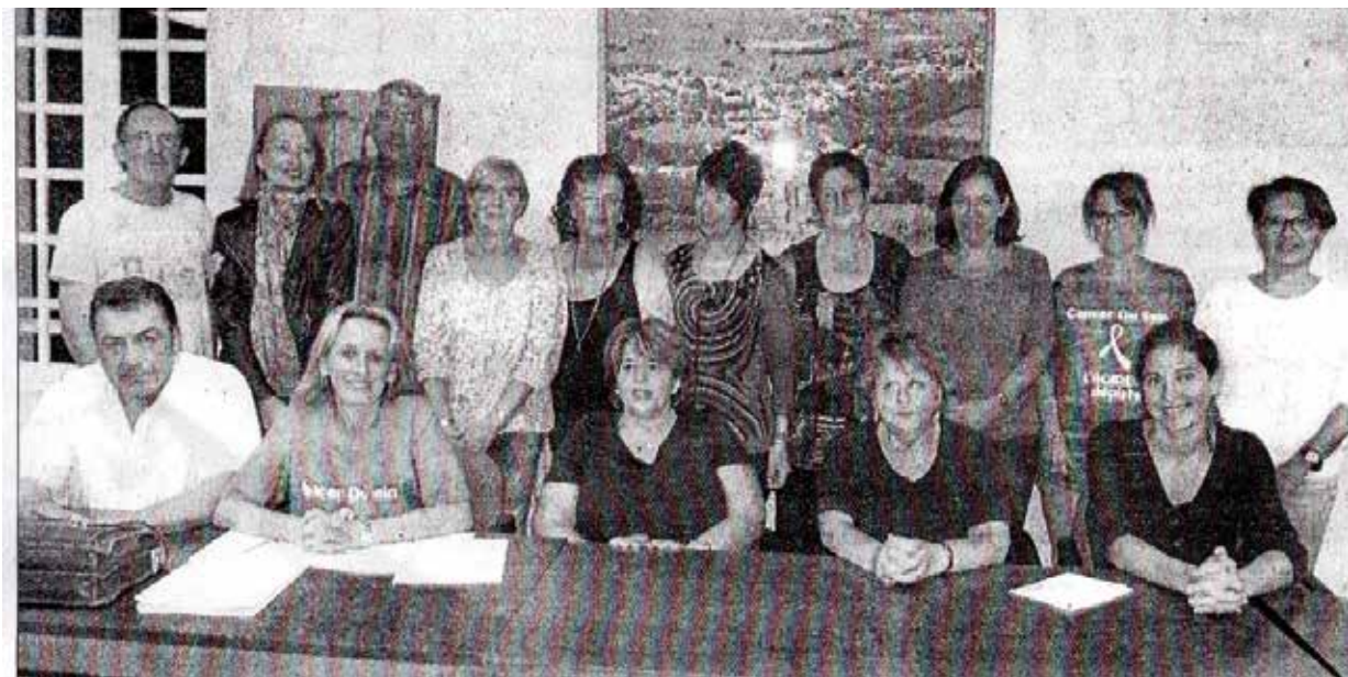
Le Centre communal d'action sociale a préparé activement la soirée théâtre du 18 octobre.